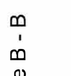
Sezlon B +